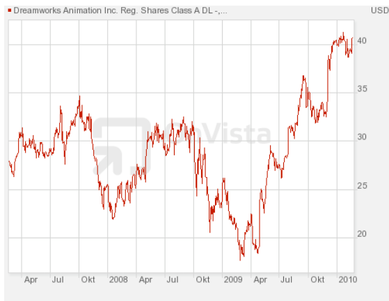
Abbildung 3: 3-Jahreschart von Dreamworks

Auch Dreamworks will den 3D-Markt erobern, doch die ersten Filme Kung Fu Panda und Monsters vs. Aliens sind erst für das Jahr 2011 angekündigt. Das liegt mir zu weit in der Ferne.