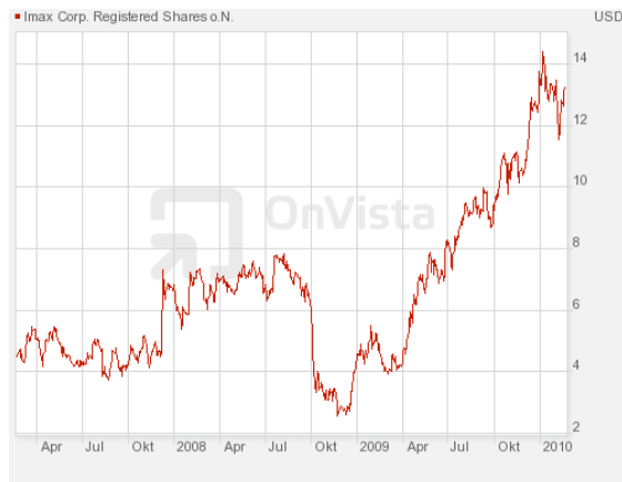
Abbildung 6: 3-Jahreschart von IMAX

IMAX ist schon seit Ewigkeiten als 3D-Spezialist bekannt und betreibt seine 360° sowie 3D-Kinos häufig auch im direkten Auftrag von Unternehmen. Es werden 350 Veranstaltungsorte betrieben, wobei diese meist nur ein Kino beherbergen. Das Unternehmen ist weltweit vertreten.