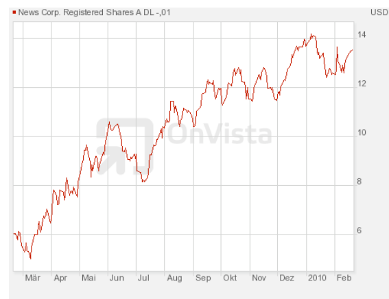
Abbildung 1: Jahreschart von News Corp. zeigt 3D-Euphorie

Für News Corp. ist dieser Erfolg zwar erfreulich, aber auch bitter nötig. Das Unternehmen kämpft gegen sinkende Werbeeinnahmen im Zeitschriften- (The Wallstreet Journal, The Times, The Sun) und TV-Geschäft (Fox, SKY Deutschland).