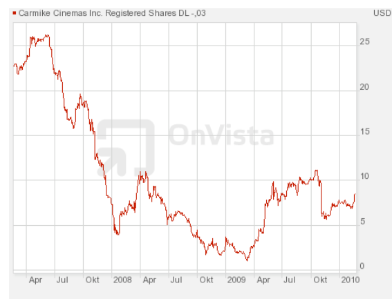
Abbildung 7: 3-Jahreschart von Carmike Cinemas