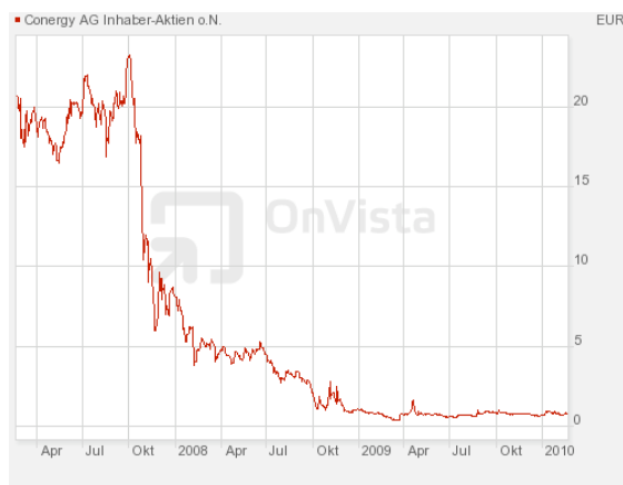
Abbildung 10: 3-Jahreschart von Conergy

Die Einigung mit MEMC spielt beim ersten Quartalsgewinn seit 3 Jahren eine bedeutende Rolle: Endlich kann die Solarmodulfabrik in Frankfurt / Oder wieder profitabel wirtschaften. Zusätzlich konnte Conergy eine bereits abgeschriebene Anzahlung an MEMC wieder aufwerten. Der Gewinn (EBITDA) betrug 36,8 Mio. Euro, die darin enthaltene Aufwertung betrug