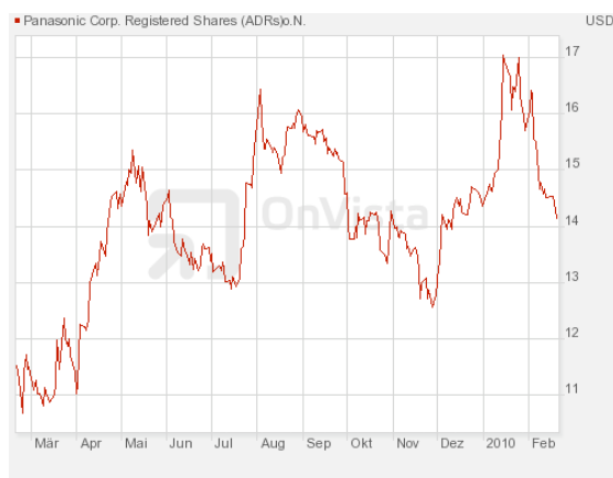
Abbildung 11: Jahreschart von Panasonic

Bis vor zwei Jahren hieß der Mutterkonzern noch Matsushita, doch weil die Marke Panasonic weltweit bekannter war änderte man den Namen. Ich selbst war vor einigen Jahren eher durch Zufall auf Panasonic aufmerksam geworden: Als Technikfreak (immerhin bin ich Deutschlands erster Internetnutzer) habe ich stets kleine, leistungsfähige Laptops gesucht.