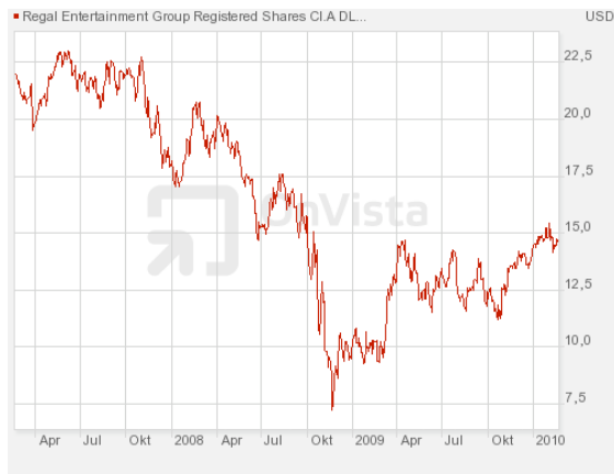
Abbildung 4: 3-Jahreschart von Regal Entertainment

Das größte Unternehmen, Regal Entertainment, ist auch das jüngste, denn es wurde erst 2002 gegründet. An 550 Veranstaltungsorten werden 6.800 Kinos betrieben. Alles in den USA.