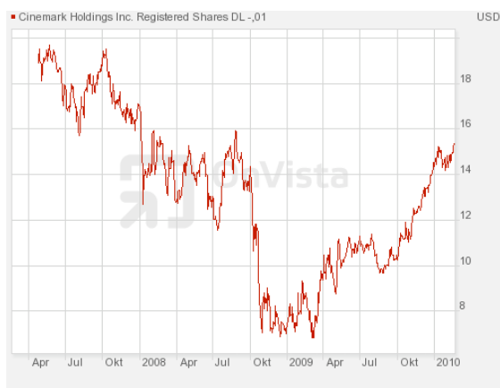
Abbildung 5: 3-Jahreschart von Cinemark

Mit 420 Veranstaltungsorten und 4.800 Kinos ist Cinemark ein wenig kleiner als Regal. Die Kinos sind jedoch über den gesamten amerikanischen Kontinent verteilt. Der Verschuldungsgrad ist mit 1,7 Mrd. USD Schulden ähnlich hoch wie bei Regal, allerdings profitiert Cinemark vom Wachstum der Schwellenländer