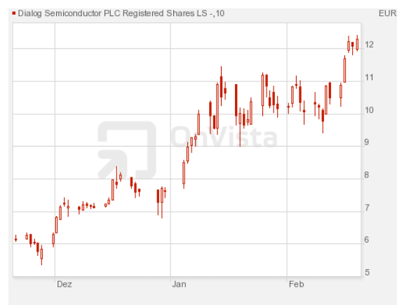
Abbildung 8: 3-Monatschart von Dialog Semiconductor

Vor einem Monat warnte ich hier an dieser Stelle vor fehlenden Katalysatoren, die den Aktienkurs von Dialog Semiconductor hätten weiter in die Höhe treiben können. Tatsächlich korrigierte der Kurs anschließend binnen weniger Tage um über 20%.