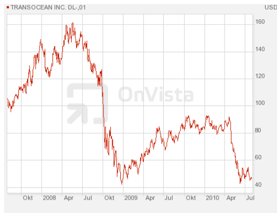
Abbildung 1: 3-Jahreschart von Transocean

licher ist es, dass die Sicherheitsauflagen für Tiefseebohrungen drastisch verschärft werden, die Kosten also drastisch steigen. So würde dann auch auf Transocean ein stärkerer Margendruck zukommen, denn beauftragende Ölkonzerne werden dadurch weniger Spielraum in der Kalkulation haben. Ich erwarte daher nicht, dass die Aktie schon bald wieder die alten Jahreshochs von Anfang 2010 bei 95 USD erreicht, vom Allzeithoch bei 160 USD ganz zu schweigen.