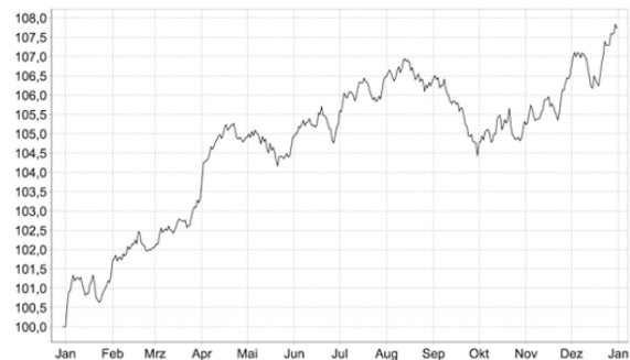
Abbildung 3: DAX Jahreszyklus, Quelle: Börse.de

Wenn ich Ihre Frage richtig interpretiere, spielen Sie auf die historisch schwache Börsenzeit an, die in den Monaten August/ September zu Buche schlagen...?